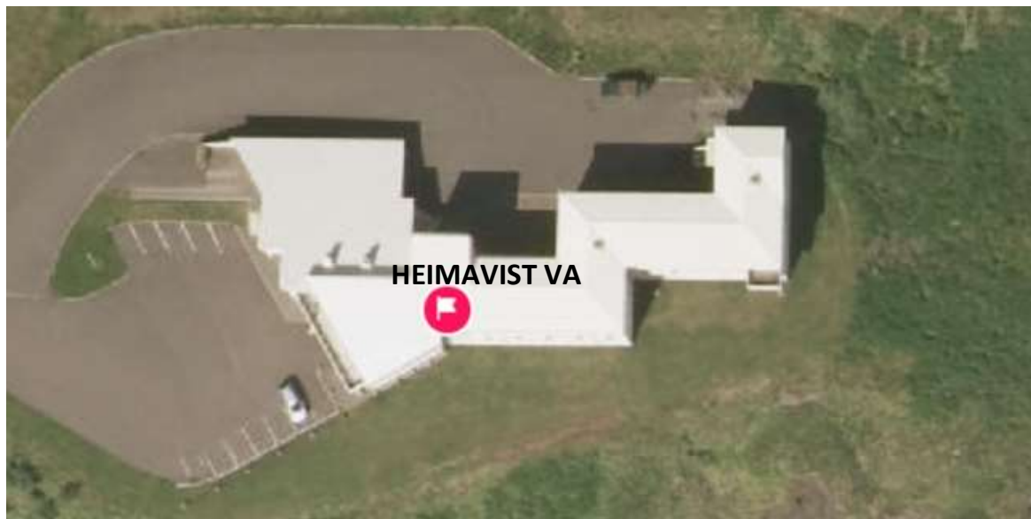
Þar að auki rekur skólinn heimavist sem staðsett er við Nesgötu 40.