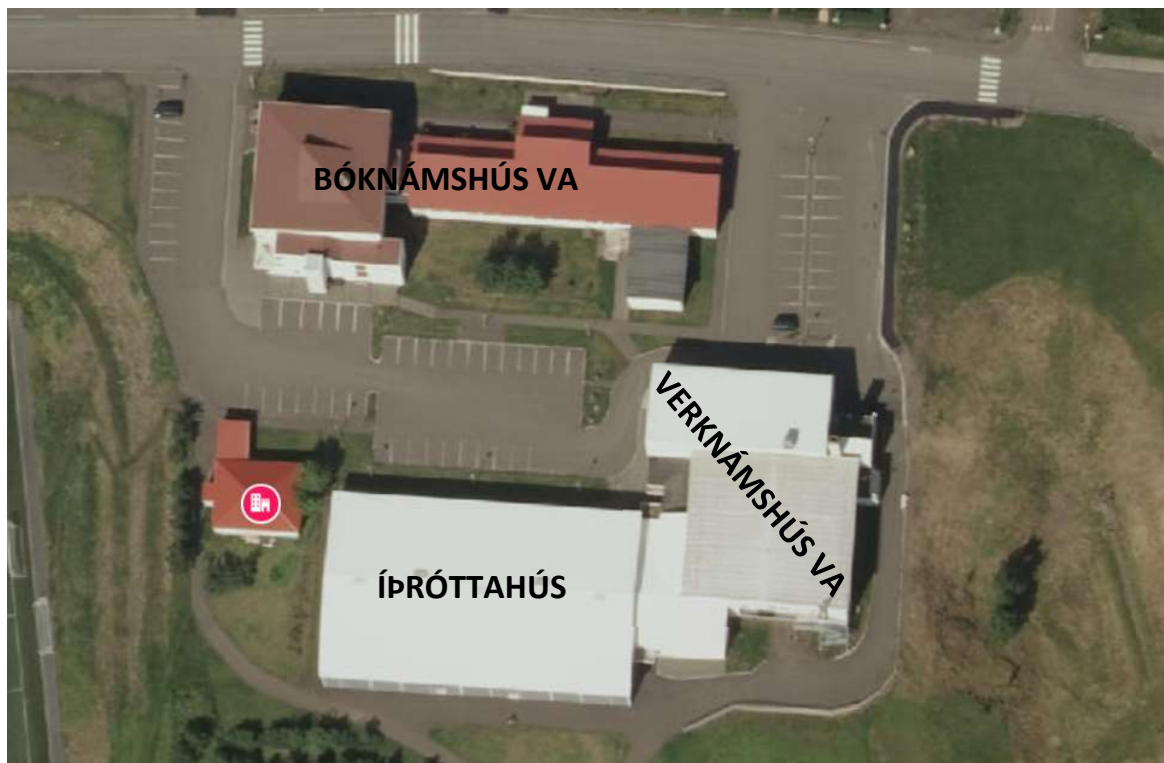
Byggingar Verknámskóla Austurlands eru staðsettar við Mýrargötu 10 í Neskaupstað.