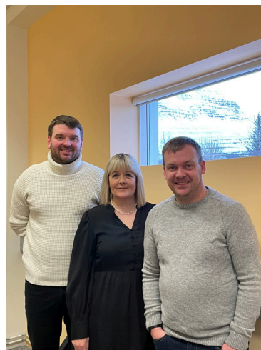
Mennta- og barnamálaráðherra ásamt skólustjórnendum